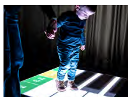
Interactive LED Floor